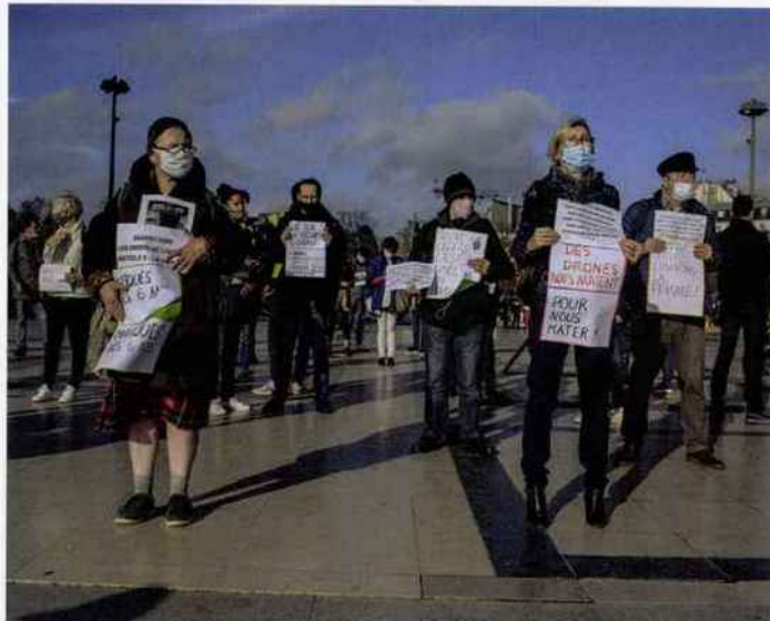
Photo: Manifestation de gilets jaunes organisée par le collectif Force jaune sur la place du Trocadéro durant la deuxième période de confinement liée à la pandémie de Covid-19. Paris, 14 novembre 2020.