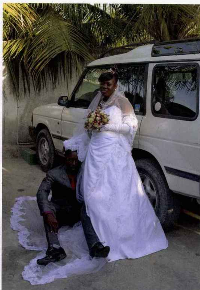
Photo de mariage traditionnelle. En posant devant une voiture, les mariés font savoir qu'ils ont les moyens de s'en offrir une. Mariani, Haïti, 15 avril 2017.

Où Divers lieux, 66000, Perpignan Quand du 28 août au 26 septembre visapourlimage.com